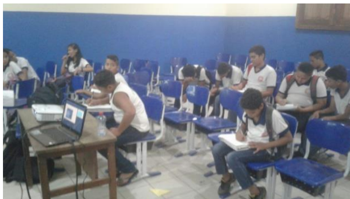
Figura 2: Momento da aplicação dos questionários

Ao apresentarmos os tópicos a serem discutidos na atividade, foram feitas perguntas sobre a temática, buscando avaliar os conhecimentos prévios dos estudantes. Moreira (2012) afirma que os conhecimentos prévios podem ser de natureza conceitual, procedimental ou atitudinal e se deve considerar o subsunçor como um conhecimento prévio especificamente relevante para uma nova aprendizagem, não necessariamente um conceito. Então, foram identificadas, no discurso dos alunos, ideias sobre o movimento da Terra em relação ao Sol, a astronomia como o estudo dos planetas e os planetas do Sistema Solar. Apesar do conhecimento exposto não apresentar domínio conceitual, ele pode ser considerado uma oportunidade para a aprendizagem com significado.