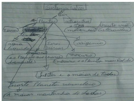
Figura 3: Mapa conceitual feito por um participante da atividade

Nos mapas conceituais, percebemos que os estudantes souberam mostrar que o Sistema Solar possui planetas e demais astros como meteoritos e asteroides. Souberam também caracterizar Mercúrio como o planeta mais rápido e Júpiter como o maior de todos.