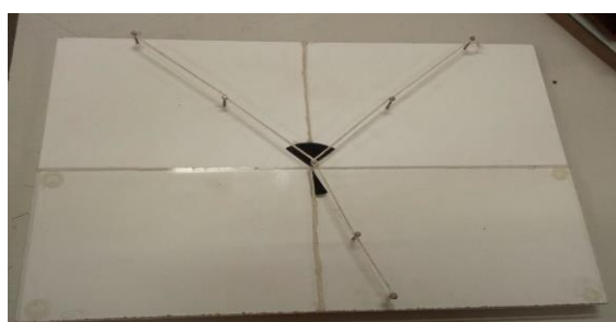
Figura 4: Maquete de Refração e Reflexão

Na terceira e última etapa da SD, sugere-se que o professor faça o uso de dois diapasões acústicos, bastões, e de duas caixas amplificadoras para explorar o fenômeno da Ressonância. Por meio de batidas, os diapasões irão vibrar, de forma que, quando estiverem na mesma frequência será presenciada o fenômeno de Ressonância.