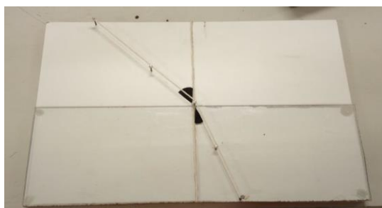
Figura 2: Maquete de Refração

Nas maquetes das figuras 2, 3 e 4 os barbantes ligados por pregos representam o raio de luz e sua trajetória no espaço. A placa de acrílico utilizada nas maquetes é analogamente referida como um vidro ou uma superfície que permita a ocorrência da Refração. Na maquete Reflexão, a superfície refletora foi representada por uma lixa d'água. Os ângulos foram representados por EVA, de modo que o aluno perceba a diferença de tamanho entre eles. Vale ressaltar que a escolha dos materiais foi feita sempre buscando a segurança e o conforto do aluno ao manusear a maquete.