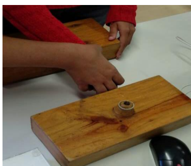
Figura 1: Aluna realizando o exercício Sentindo as Ondas

A primeira etapa consiste na realização de um exercício mental denominado Sentindo as Ondas. Este exercício consiste em o aluno projetar com os dedos sobre uma superfície plana a representação espacial do que seria uma onda mecânica transversal. Em uma superfície plana, utilizando duas régua ou dois objetos retangulares como anteparos, delimitando a área sobre a superfície, o professor deverá guiar o indicador do aluno, realizando o movimento de vai e vem perpendicularmente entre os anteparos, com isso o aluno terá dimensão dos limites e da periodicidade do movimento, fazendo assim analogias com as ondas mecânicas e sua propagação no espaço. Após esta etapa, o professor deverá auxiliar o aluno puxando a sua mão paralelamente aos anteparos, como mostrado na figura 1. Após a junção destes movimentos combinados, os alunos estarão descrevendo com os próprios dedos a representação de uma onda mecânica. As definições de crista, vale, frequência e comprimento de onda e suas características podem ser exploradas nessa etapa da SD.