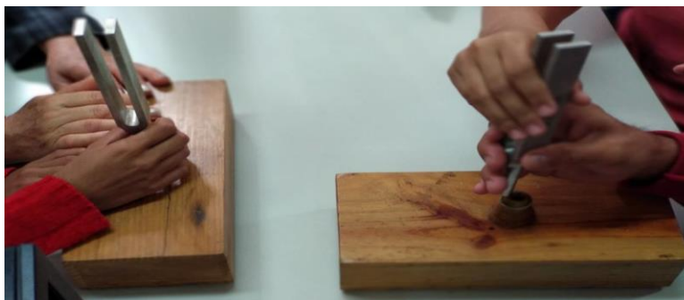
Figura 5: Alunos fazendo o reconhecimento dos materiais

do professor, o aluno deve provocar perturbações no sistema, batendo com o bastão na parte superior de um dos diapasões. Após isso, por meio de vibrações e estímulos auditivos, o aluno perceberá o fenômeno da Ressonância acontecendo.