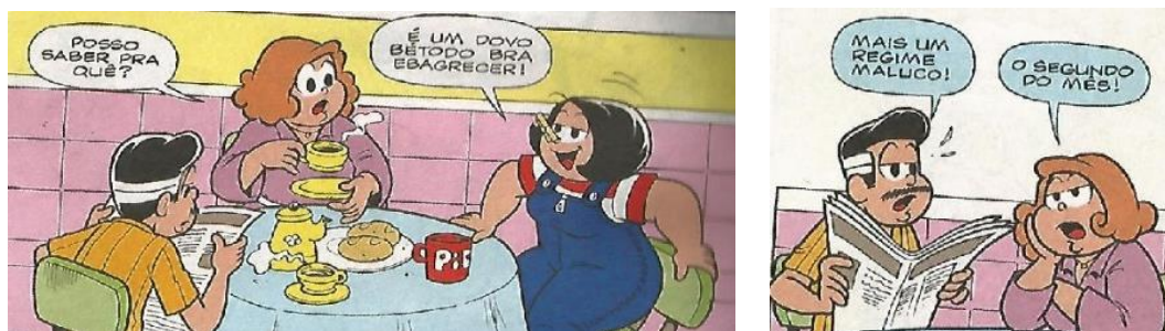
Figura 01: Pipa contando sobre o seu “novo” método para emagrecer.

O corpo de Pipa é um corpo que a incomoda, é inadequado e que ‘precisa ser corrigido’. Ela sempre está em busca de algo que ainda não alcançou e investe grande parte de seu tempo e trabalho na busca do almejado corpo e com isso sofre. Pois, “a mulher que não cuida do seu corpo está sujeita a uma série de punições: a perda do marido (ou da possibilidade de ter um), de sua autoestima, do amor próprio, do respeito por si, do respeito pelos outros” (SARRAF; BASTOS, 2017, p.06).