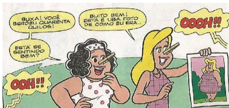
Figura 02: Resultados alcançados através do método escolhido por Pipa.

Dessa maneira, o magro se apresenta numa posição central, considerada como a posição “não problemática”, enquanto que todas as outras posições de sujeito estão subordinadas ou a margem dela, ou seja, o excêntrico (LOURO, 2013, p.46). Desse modo, a magreza se configura como uma referência que deve ser considerada natural e tudo aquilo que não cabe ao central, como o corpo gordo, deve buscar se enquadrar ao que é a “norma”.