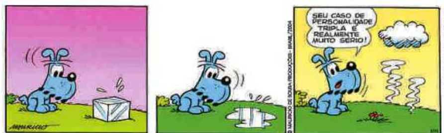
Figura 1 – Personagem Bidu observando a mudança do estado físico da água (Maurício de Sousa, 2004).