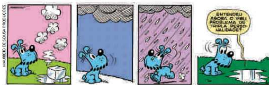
Figura 2 – Personagem Bidu observando a formação da chuva, a partir da evaporação da água (Maurício de Sousa, 2004).

Uma segunda tirinha foi identificada no livro 2 da coleção, com o mesmo personagem observando a evaporação da água, com a formação da chuva e a resposta da ‘água’ a essas observações, conforme vê-se na figura 2.