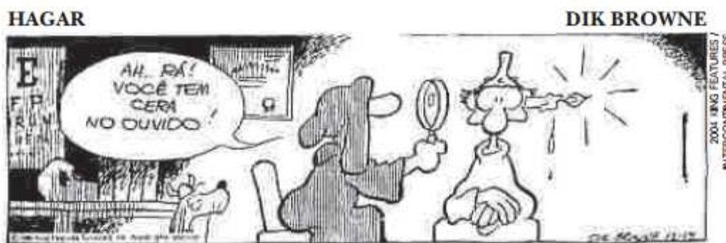
Figura 5 – Tirinha de Dik Browne que identifica “cera” no ouvido do personagem.

Por fim, a última tirinha apresentada nesta pesquisa (Figura 5), é uma alternativa para o ensino de conteúdos de Química Orgânica, visto que na educação básica, esta área da Química é geralmente ensinada pelos professores de forma tradicional, com o ensino de suas funções, nomenclaturas, sem relacionar com aspectos importantes como as suas propriedades dos seus compostos e seus impactos no meio social, ambiental e econômico.