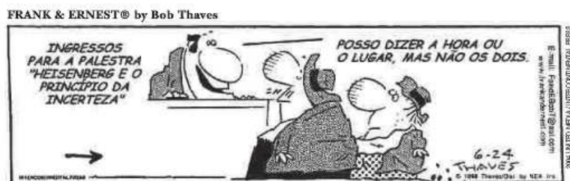
Figura 3 – Tirinha de Bob Thaves que faz relação direta do título da palestra com a fala do vendedor de ingressos.

Ainda na perspectiva de que o leitor precisa compreender as informações apresentadas na tirinha ou no quadrinho, para entender a ‘piada’ e assim gerar o humor nela implícito, a tirinha a seguir, exige do seu leitor uma compreensão mais aprofundada sobre o “Princípio da Incerteza de Heisenberg” (Figura 3).