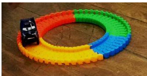
Figura 1: Carrinho à pilha e sua pista

A fim de significar o tema da aula, levamos dois recursos, um carrinho à pilha com uma pista, como mostra a figura 1 e uma maquete tátil (figura 2). O carrinho foi apresentado logo no início da atividade e foi sugerido aos alunos que em um primeiro momento brincassem com o objeto e em seguida analisassem coletivamente o brinquedo como um todo, descrevendo tudo o que lhes despertasse a atenção. A maquete tátil foi apresentada ao final da atividade, e esta foi trabalhada como um modelo de síntese de tudo aquilo que foi discutido durante a oficina. Cabe ainda ressaltar, que a roda presente na maquete podia girar sobre a superfície onde ela estava fixada. Desse modo, foi representado o sentido de movimento necessário em uma roda de tração motora para que um automóvel saia do repouso.