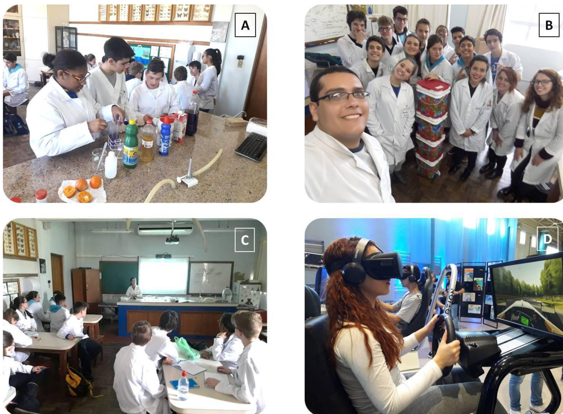
Figura 1. Oficinas do clube de ciências organizado pelo PET Biologia em uma escola privada de Porto Alegre, sobre pH (A), sobre compostagem e reciclagem de lixo (B), sobre eucariotos basais (C) e visita ao Festival Marista de Robótica da PUCRS (D).

No primeiro dia, foi feita a apresentação do grupo, a exposição das regras de funcionamento de um clube de ciências e um experimento sobre pH (Figura 1A). No segundo encontro, foi realizada uma discussão sobre descarte de lixo e foi confeccionada uma composteira (Figura 1B). No terceiro, investigaram a riqueza de vida em uma gota de água, através da observação de meios de cultura de eucariotos basais em microscópio (Figura 1C). No quarto encontro, realizaram um passeio científico no festival Marista de Robótica na PUCRS (Figura 1D).