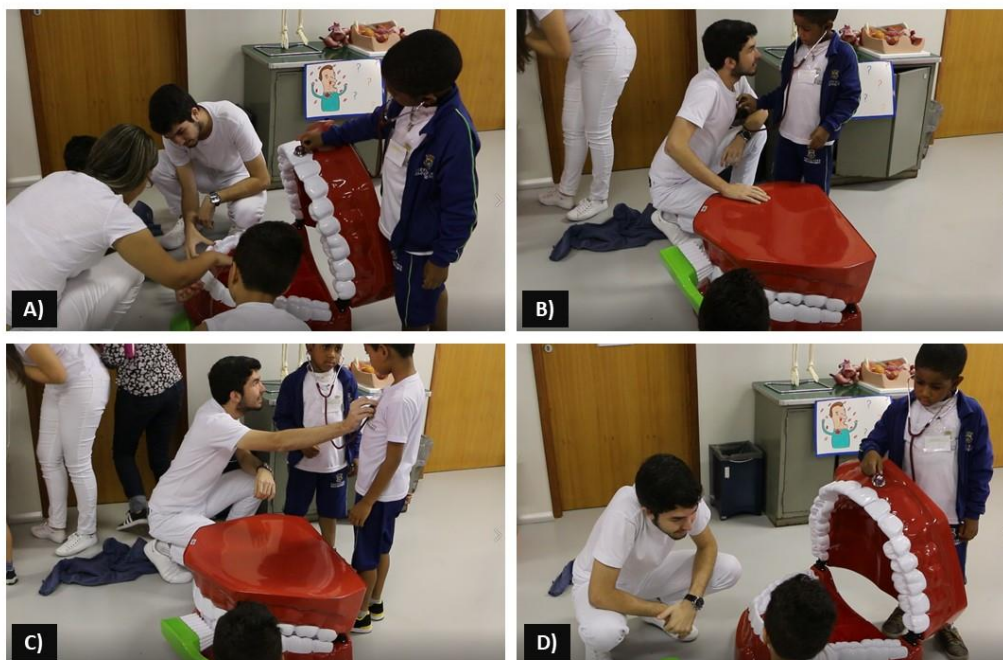
Figura 2 – Sequência de uma cena dos vídeos gravados durante as oficinas.

Observamos então, pela descrição e análise desse evento, que a criança é fadada a pensar e agir de acordo com as expectativas dos adultos, mas ela se coloca, resiste e marca o seu lugar. Ela escuta os adultos, às vezes cede, mas não desiste de seguir o seu percurso. Ela parecia querer nos dizer aquela forma de utilizar o estetoscópio era carregada de sentidos e essencial para que o seu processo de aprendizagem acontecesse e por isso resistir era essencial. A criança apresenta-se então como um ser autônomo, que pensa e que confia nas suas próprias escolhas.