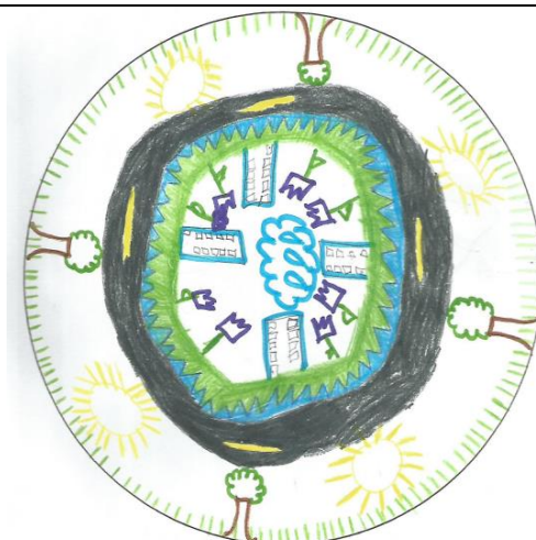
Figura 02: Desenho em mandala representando a concepção sistêmica de ambiente – Mista. Composta por elementos naturais (árvores, sol, gramíneas, nuvens e flores) e elementos antrópicos (asfalto e edifícios).

No caso da representação de ambientes, foi possível aos estudantes abarcar os diversos conceitos ecológicos e a observação dos ambientes que fazem parte do seu contexto a fim de elaborar suas mandalas.