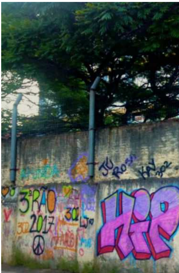
Figura 2: Foto de um muro da escola retratando arte de rua.

Na imagem aparece a palavra Hip, de hip-hop, um estilo de vida que tem como objetivo se afirmar como identidade cultural e ocupar espaços públicos. O movimento do hip-hop pode ser considerado um híbrido, pois carrega consigo a mistura da temática urbana com o orgulho da herança africana. O hip-hop desde o início luta por seu espaço e valorização com o apoio de movimentos negros e define como uma de suas propostas a conscientização da população marginalizada proveniente das periferias e favelas da sua condição política e social. Na imagem ainda é possível observar elementos de identificação dos autores da pichação, como nomes, turmas e o ano. Isso demonstra um processo de ocupação e afirmação de um grupo de alunos sobre os espaços da escola na forma mais transgressora que são as pichações.