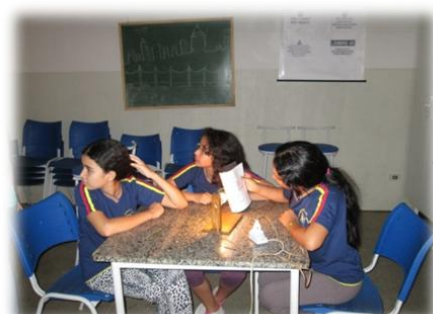
Figura 2: Observação com mapa dobrado

E a terceira aula, foi na sala de informática, utilizaram a sala virtual, para o uso dos simuladores, eles visualizaram as sombras de acordo com a latitude das cidades em diferentes meses do ano, além de observar a incidência do Sol na Terra.