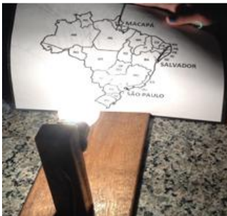
Figura 1: Material utilizado no laboratório

A segunda aula, ocorreu no Laboratório de Ciências, a partir dos materiais distribuídos pela professora, os alunos testaram suas hipóteses, descobriram porque as cidades citadas apresentavam sombras diferentes ao meio dia. Após essa atividade, os alunos retornam à sala virtual para visualizar as simulações e a animação.