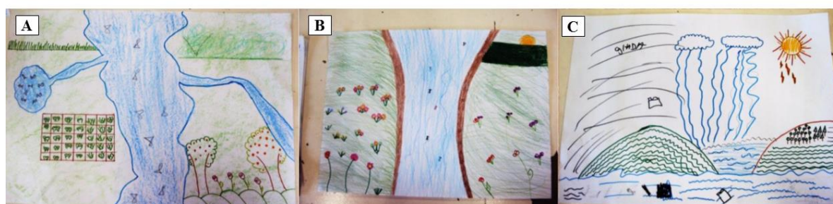
Figura 2: (A; B; C. Cartazes confeccionados pelos alunos: Representação da Bacia Hidrográfica São José dos Dourados).

Na parte da entrevista transcrita na Tabela 3, explorava-se o conteúdo dos cartazes elaborados por eles durante uma das atividades (Figura 2). Foi possível notar que todos os alunos relataram alguma situação vivenciada, reconheceram o significado das informações contidas nos desenhos, bem como a presença de alguns conceitos teóricos relacionados à Bacias Hidrográficas, como pode ser evidenciado no relato do Aluno 1.