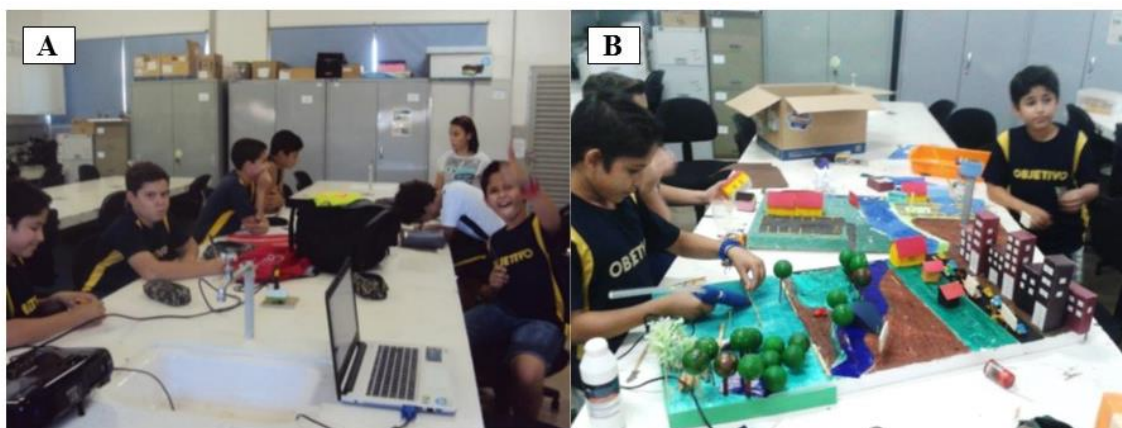
Figura 3: (A. Alunos durante a discussão e apresentação dos conceitos gerais sobre microbacias; B. Momento de confecção da Maquete: Representação da Bacia Hidrográfica São José dos Dourados).

No momento final da entrevista, os alunos relataram (Tabela 4) sobre as imagens relacionadas com a atividade prática sobre Microbacias (trabalho com mapas e jogos) e por fim, a confecção da maquete, representadas nas Figuras 3 A e B.