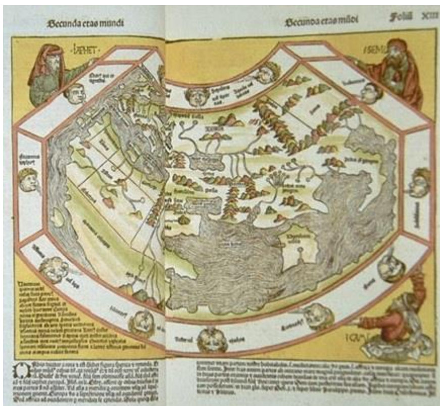
Figura 5: Hartmann Schedel. Liber chronicarum Secunda etas Mundi (fol. XIV-XIIIr). Xilogravura colorida à mão. Nuremberg, Anton Koberger, 1493

A representação da Terra inserida nesse cosmo é encontrada nas folhas XIV-XIIIr da Crônica de Nuremberg: