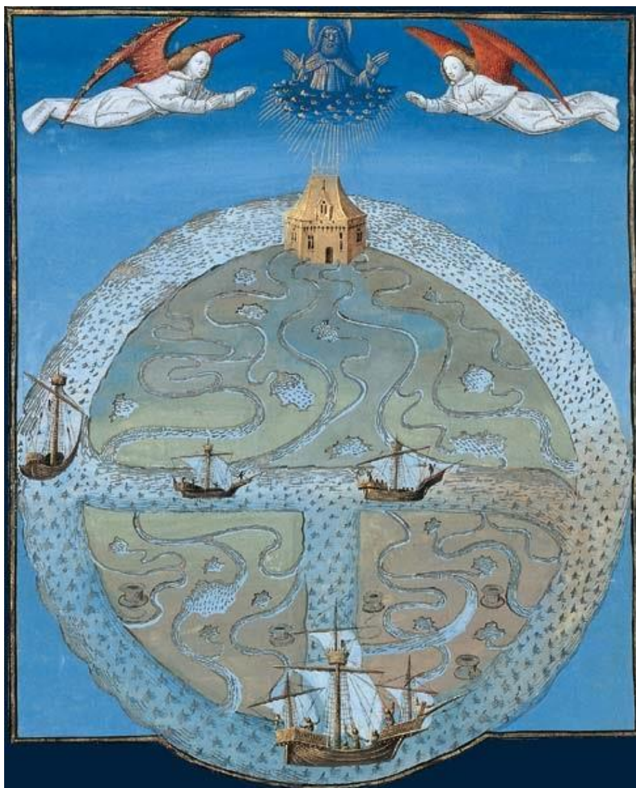
Figura 3: O mapa T-O ilustrado no Livro de propriedades das coisas - Barthélemy l'Anglais (c. 1200), com iluminação do manuscrito em pergaminho, 1480, França.

Ainda sobre os mapas T-O, existem outras variações, a partir da representação inicial de Isidoro de Sevilha. Como exemplo, o mapa-múndi ilustrado em uma enciclopédia medieval de Barthélemy l'Anglais, " Livre des propriétés des choses " (Livro das Propriedades das coisas), realizada no século XV: