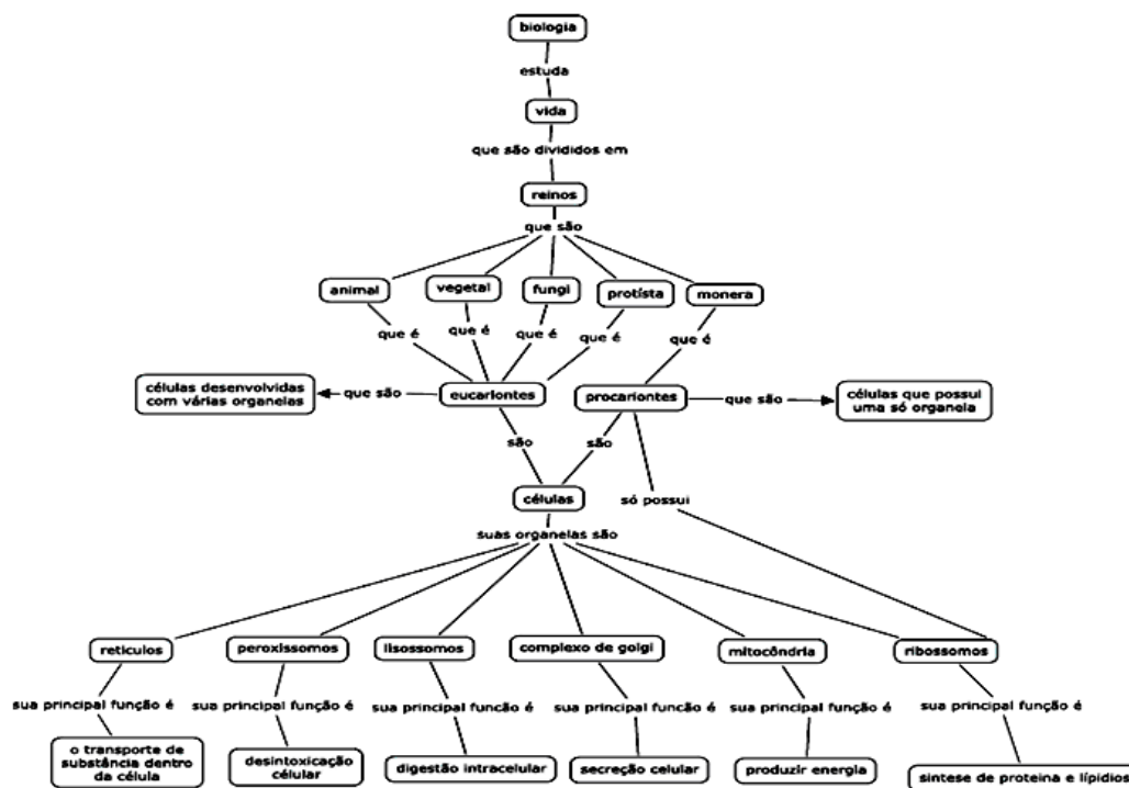
Figura 2. Mapa conceitual construído pelo estudante 20.