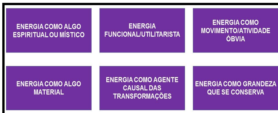
Figura 02: Perfil Conceitual de Energia no Contexto de Ensino da Física e da Química

A partir da matriz apresentada anteriormente, foi proposto um perfil conceitual para o conceito de energia nos contextos de ensino da Física e da Química com seis zonas, apresentadas na figura 02: