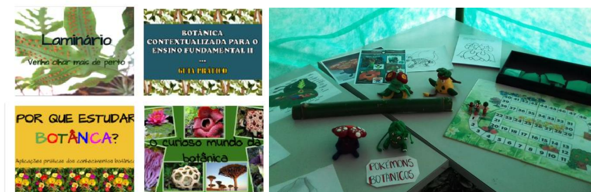
Figura 5: Materiais produzidos pelo grupo: à esquerda, capas dos materiais impressos e disponibilizados on-line; à direita, Pokémons botânicos confeccionados em biscuit, acompanhados de ilustrações e um jogo de tabuleiro.