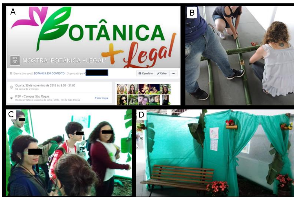
Figura 3: Mostra “Botânica+Legal”. A) Evento cadastrado no @Facebook; B) Parte da montagem em bambu; C) Visitantes no estande; D) Aparência externa do estande da mostra.

Ao término dos trabalhos, os participantes decidiram realizar uma exposição pública dos trabalhos produzidos. O monitor sugeriu que fosse montada uma mostra no corredor central da IES, e a sugestão foi aceita por todos. Decidiu-se, então, realizar o evento “Mostra Botânica+Legal” para a exposição pública das produções em visita aberta na própria IES. Um estande de 20 m 2 construído com armação em bambu e revestimento de material têxtil TNT foi instalado pelos próprios participantes, em mutirão, nos dias 28 e 29 de novembro de 2016. O evento foi cadastrado como projeto de extensão institucional, atingindo 103 participantes em dez horas de atividades, no dia 30 de novembro de 2016 (Figura 3).