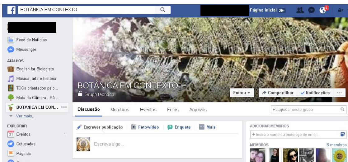
Figura 1: Página inicial do grupo “Botânica em Contexto” no @Facebook.

Os estudantes concordaram em trabalhar durante todo o semestre tendo como base uma metodologia de trabalho colaborativa e democrática com o intuito de promover a interação entre os alunos de semestres diferenciados, o compartilhamento de saberes entre colegas e o fomento de voz ativa de cada um dos integrantes.