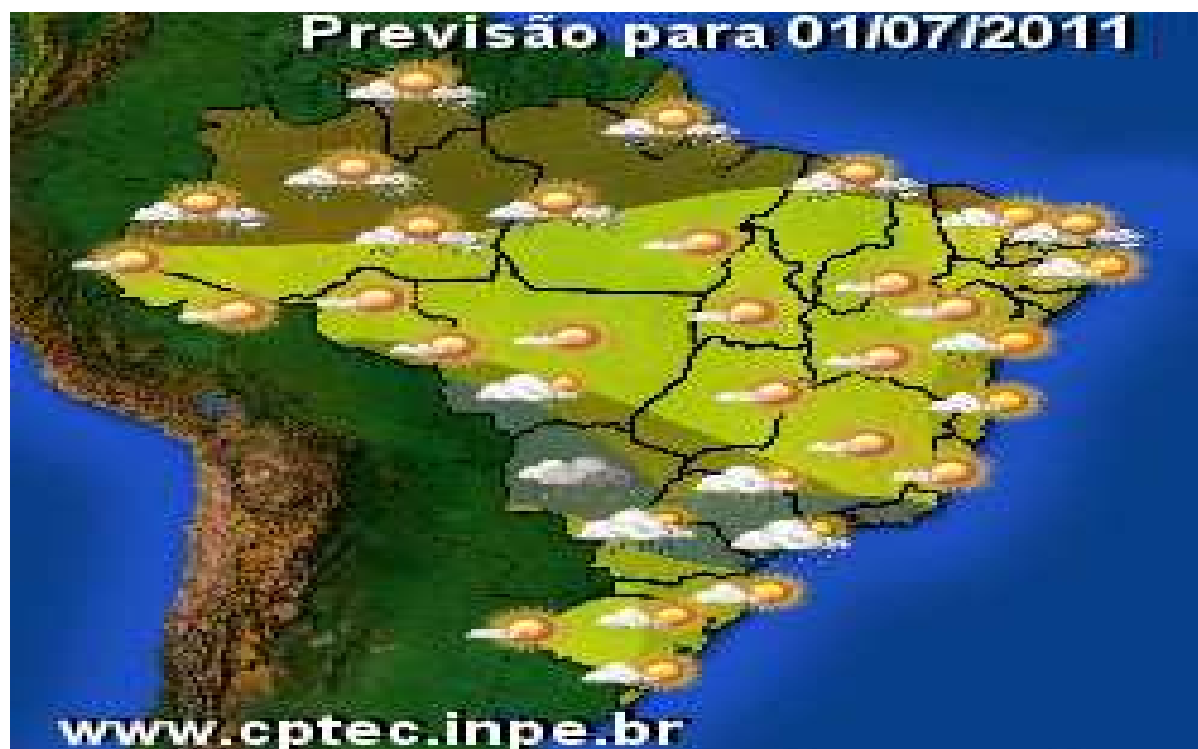
Figura 2: previsão do tempo no Brasil dia 01/07/2011.

Uma intensa massa de ar frio polar penetra sobre o centro-sul do país provocando queda de temperatura nestas áreas. No interior da região haverá geada ampla, que se estende também para o sul de MS e a faixa sudoeste de SP.