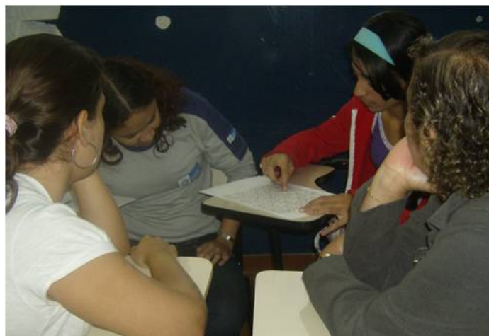
Figura 4: Grupo de alunos assistindo ao Mattix.