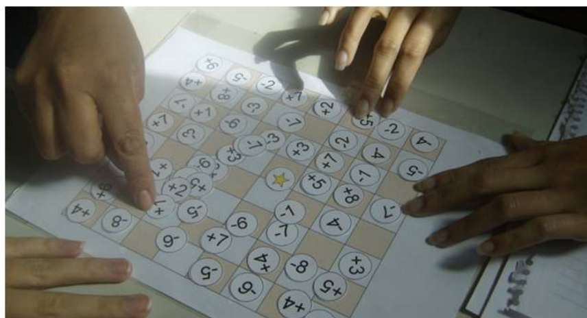
Figura 3: Alunos preparando o jogo.

A única orientação, sobre os números existentes nas peças, que foi dada ao aluno/jogador, ao início da atividade, é que os algarismos positivos representam pontos ganhos e os negativos pontos perdidos.