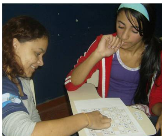
Figura 5: Estudantes entretidos com a atividade proposta.

Em um terceiro momento, os alunos foram estimulados a discutir sobre a atividade realizada, dizendo o que os levou a fazer algumas movimentações com a peça-estrela durante o tempo do jogo. Como o jogo está relacionado ao conteúdo números, operações e álgebra, o aluno foi levado à abordagem e desenvolvimento de operações matemáticas simples (adição, subtração, multiplicação e divisão), com a busca de resoluções de expressões numéricas e equações de primeiro grau.