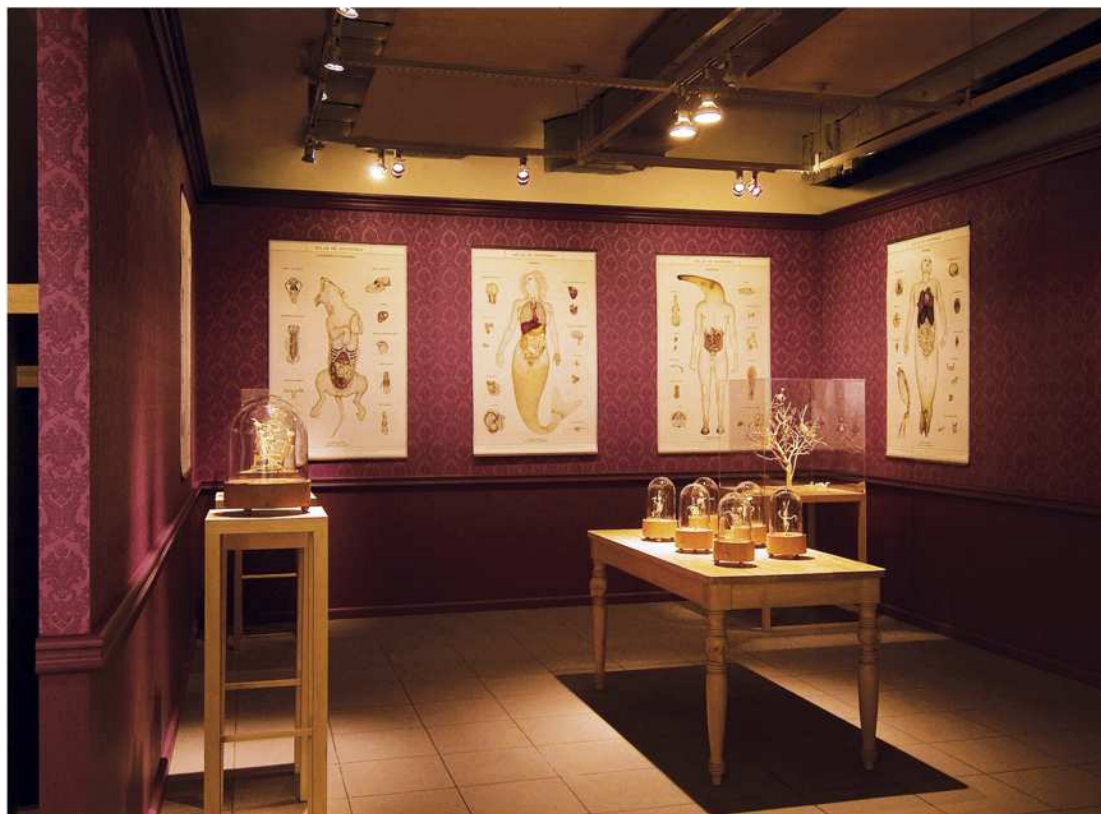
Figura 1 – Instalação Memento mori , Instituto Goethe, Porto Alegre – RS, 2007.

Para recriar a esfera desses Gabinetes, Corrêa dispôs nas paredes da sala de exposição um papel de parede de cor forte, quase fúnebre. Nessas paredes estão pendurados atlas anatômicos de figuras do folclore brasileiro, como o Curupira, Capelobo, Ipupiara, a Ondina, Cachorra da Palmeira e um relógio-cuco que corre em ritmo acelerado. No centro da sala há uma mesa de madeira, com caveiras talhadas em seus pés e, sobre elas há redomas de caixinhas de músicas, sem bailarinas, mas com esqueletos de pássaros criados pelo artista (Figura 1).