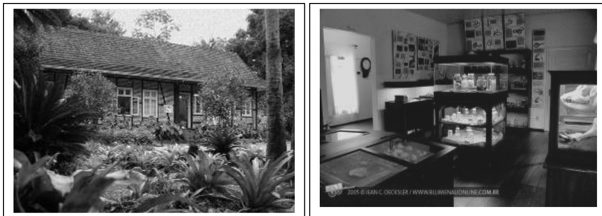
Figura 1 – Vista externa do MEFM e de uma de suas salas

Blumenau é uma cidade situada no estado de Santa Catarina/BR e teve alemães como colonizadores. Entre eles Johann Friedrich Theodor Müller, mais conhecido como Fritz Müller. O Museu, que leva o seu nome, é uma das casas em que morou o naturalista no Brasil (figura 1).