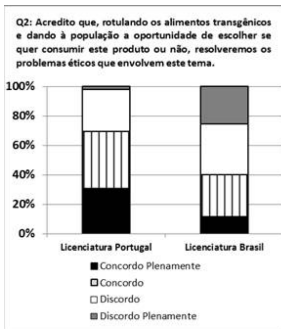
Figura 1. Frequência de respostas dos estudantes em relação à questão Q2.

Para analisarmos os dados somamos os itens “Concordo plenamente” e “Concordo”, contrastando com “Discordo” e “Discordo Plenamente”, também somados.