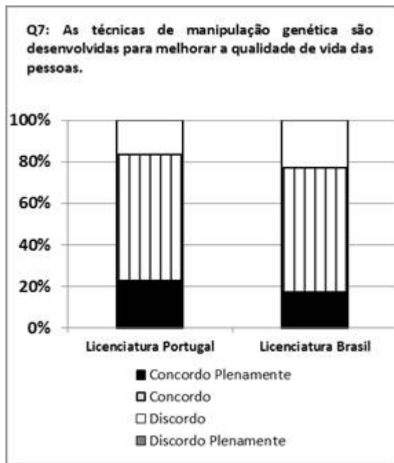
Figura 3. Frequência de respostas dos estudantes em relação à questão Q7.