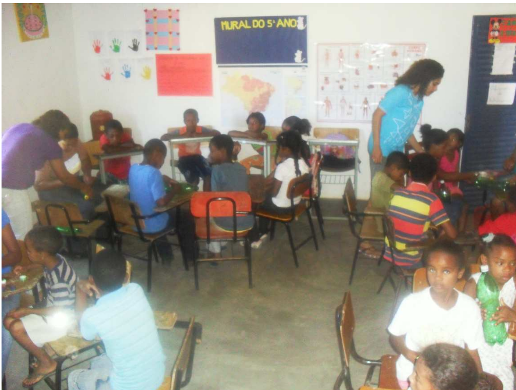
Figura 2 - Exemplo de uma atividade de educação não-formal sendo realizada na comunidade dos Kilombolas, no Estado de Goiás - Brasil.