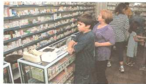
Imagem 1 – PROJETO ARARIBA, 2006, p.96

O problema se agrava à medida que as pessoas são induzidas pela propaganda a consumir um determinado medicamento.