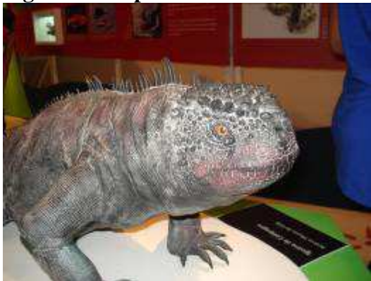
Figura 3 – Réplicas de animais.