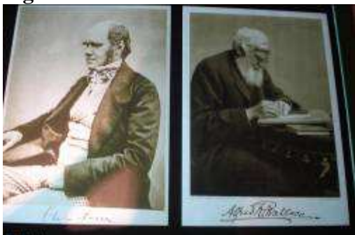
Figura 7 - Wallace e Darwin.