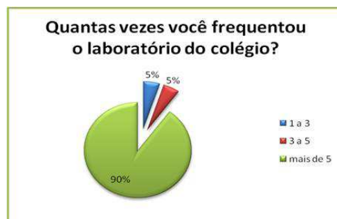
Figura 2: Frequencia relativa do uso do laboratório do Colégio Estadual Luiz Vianna, durante o 2º semestre de ano 2010

Após o início do projeto a realidade exposta acima foi modificada. A utilização do laboratório foi feita por todos os alunos da turma pesquisada durante o ano letivo, tendo 20 respostas positivas dos 20 que responderam ao último questionário 3 , referindo também que 90% deles frequentaram o laboratório mais de 5 vezes durante as aulas de biologia (Figura 2).