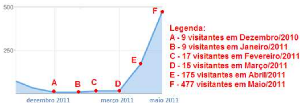
Figura 3: Numero de acessos ao blog de dezembro/2010 a maio/2011.

Conforme Figura 3, é possível perceber o considerável aumento nos acessos entre os meses de Abril e Maio. Esse crescimento se deve também a divulgação feita pelos estagiários durante as demais atividades do PIBID.