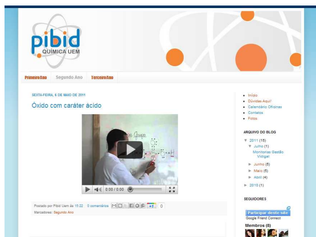
Figura 1: Página do blog em funcionamento

Esse espaço é continuamente avaliado com o propósito de aperfeiçoá-lo, assim como o de analisar a eficácia dos resultados atingidos corroborando com os objetivos da criação e desenvolvimento da página.