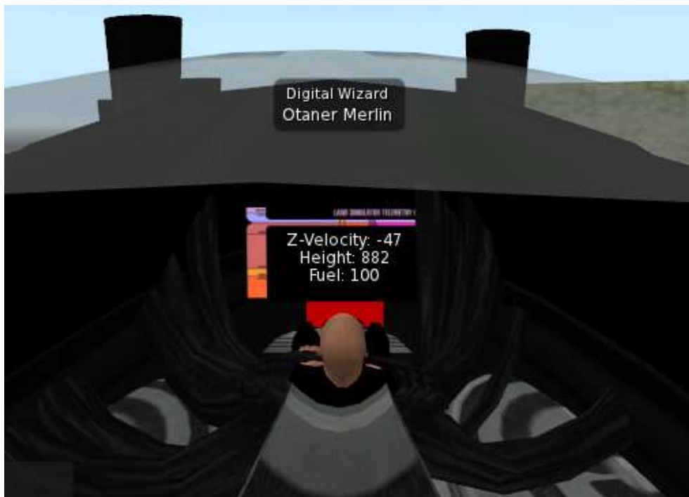
Figura 4 – Painel exibindo a altura e a velocidade de queda da nave, bem como a quantidade restante de combustível

Durante a movimentação da rampa, o script da nave exibe na janela de chat e num painel no campo visual do piloto um briefing da ação que está prestes a ocorrer, informando que a tecla PgUp do seu teclado deve ser utilizada para acionar o ‘retrofoguete’ e reduzir a velocidade de queda e lembrando que quando o combustível acabar, não disporá mais esse recurso. Durante a queda, são exibidas no painel do piloto a altura e a velocidade de queda da nave, bem como a quantidade restante de combustível (Figura 4).