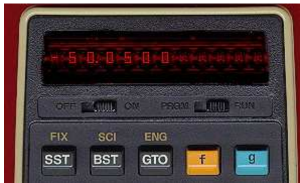
Figura 2 – Jogo Moon Landing Simulator da HP-25

Como em quase todas as versões deste simulador, o usuário está a bordo de um módulo de pouso, descendo em queda livre em direção à superfície rochosa com um suprimento limitado de combustível e tem que acionar os retrofoguetes para reduzir a velocidade de queda e pousar em segurança, sem colidir. O simulador calcula e informa continuamente a velocidade vertical e a altura do módulo durante a descida. A Figura 2 mostra situação inicial do jogo, na versão da calculadora HP-25, exibindo uma altura de 500 pés e velocidade vertical de -50 pés/s.