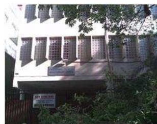
Fig. 8: Escola Paulo Mendes Campos

Nas escolas visitadas estabelecemos contato com os professores de Ciências, pessoalmente e, posteriormente, através de questionário, para compreender o processo local de escolha e distribuição dos LD. Em nossa análise, foram considerados 10 questionários, abordando questões metodológicas, de conteúdo e do processo de escolha dos Livros.