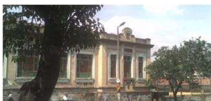
Fig. 4: Escola Estadual Olegário Maciel