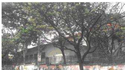
Fig. 2: Escola Professor Caetano Azeredo

E. Municipal Paulo Mendes Campos (fig.8), Av. Assis Chateaubriand, nº. 429 – Floresta.