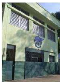
Fig. 3: Escola Municipal Imaco