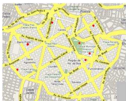
Fig. 1 – Localização das escolas visitadas, destacadas em vermelho, da Região Centro-sul de BH delimitada pela Av. do Contorno (macro contorno amarelo)

O estudo foi realizado em 7 escolas públicas de Belo Horizonte situadas na região central, nos limites da Avenida do Contorno (figura 1) que, além do terceiro e quarto ciclos do Ensino Fundamental, ofertam o Ensino Médio, para permitir uma extensão futura da pesquisa, incluindo o Programa para o Ensino Médio (PNLEM 2007 e PNLD 2012). Os dados foram coletados em 2009, analisados em 2010, usando como referência os livros adotados em mais de uma escola, 3 coleções recomendados no Guia do PNLD 2008, além de Cruz (2006), não constante do Guia. Apresentamos a seguir a localização das escolas visitadas, todas na Regional Centro-sul da Capital, bem como fotos de suas fachadas.