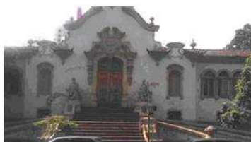
Fig. 5: Escola Estadual Pedro II