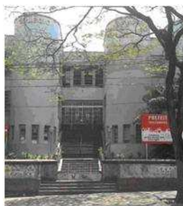
Fig.7: Colégio Marconi