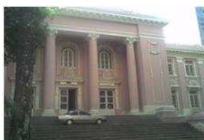
Fig. 6: Instituto de Educação