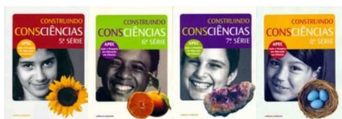
Fig. 11: Capas da coleção Construindo Consciências: Ciências