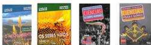
Fig. 10: Capas da coleção Ciências: O Meio Ambiente.