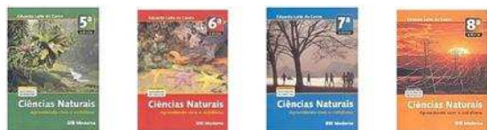
Fig. 12: Capas da coleção Ciências Naturais: Aprendendo com o Cotidiano

CANTO, Eduardo Leite do. Ciências Naturais: Aprendendo com o Cotidiano, São Paulo: Moderna, 2006.