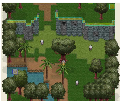
Figura 3: cenário do jogo

Nele, os estudantes comunicam-se de formas diferentes e também experimentam objetos diferentemente. Esta troca de informações é um importante aspecto do processo de aprendizagem que tem como recurso as diferentes mídias.