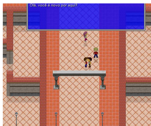
Figura 4: caixa de diálogo

A interatividade, portanto, é colocada na perspectiva dos participantes, que entram em contato com uma linguagem capaz de provocar uma ação previamente pensada por seus idealizadores. Sua descrição se aplica aos objetos, textos (linguagem escrita) e som que compõem o RPG, bem como os outros jogadores envolvidos na experiência, compondo “ferramentas culturais” para a ação mediada (COLINVAUX, 2005). Segundo a autora, interatividade se relaciona diretamente com a especificidade dos ambientes. Neste trabalho,