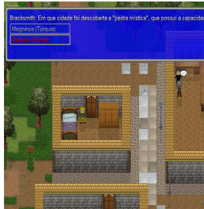
Figura 2: cenário do jogo

fases do jogo e o entendimento ou interpretação que é dada a essa orientação é que se criam novos níveis de definição de situação. Assim, houve a preocupação com uma revisão contínua do conteúdo presente nas caixas de diálogo do aplicativo, para que também o texto não possibilitasse diferentes definições de situação quando da execução de determinada tarefa. Trata-se de um elemento de suma importância a ser considerado, visto que todos os jogadores atuam em prol de um mesmo objetivo no RPG. Em outras palavras, uma atividade que envolva o uso das mídias deve ser planejada e apresentada de modo a evitar que se crie uma variedade muito grande de definições de objetivos, para que o foco da ação não se perca. Da mesma forma, o "roteiro" da interação vai depender não apenas do parceiro mais capaz, mas também da adequação do material exposto em relação ao seu objetivo.