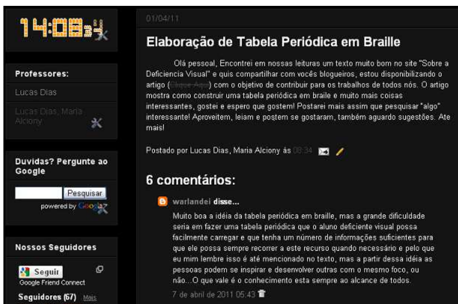
FIGURA 3. O blog como veículo de divulgação do conhecimento científico.

O diário virtual coletivo (blog) funcionou como meio de divulgação do conhecimento científico, disponibilizando contribuições recentes da comunidade de pesquisadores sobre esta temática tal como apresentado na figura 3. Desta forma, também parece atuar como canal de encurtamento da distância entre escola e produção de conhecimento científico.