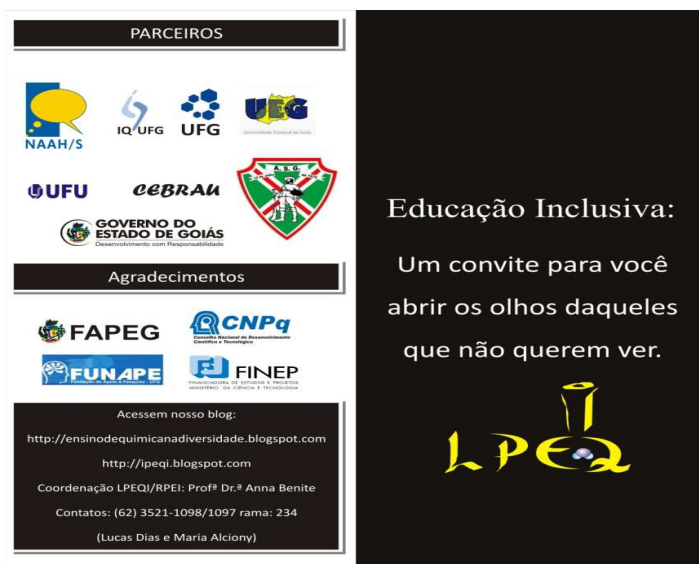
Figura1- Folder de divulgação do blog (parte externa).

a narrativa, um gênero do discurso. Assim, estes podem narrar sobre os obstáculos encontrados no processo de ensino aprendizagem de química para deficientes visuais, participar de enquetes, questionários e fóruns relacionados ao direcionamento da educação inclusiva e, quem sabe, repensar a sua atuação como professores diante dessa nova realidade educacional.