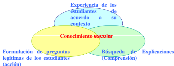
Figura 1. Representación de la construcción de conocimiento escolar, basado en Segura, (1998).

Es así como Segura, (1999) plantea que el conocimiento escolar es posible por la formulación de preguntas legítimas de los alumnos que apuntan tanto a la acción (forma de proyectos) como a la comprensión (búsqueda de explicaciones). Las vivencias de conocimiento se orientan por el dominio experiencial que comparten los estudiantes y por su estructura son similares a la búsqueda en la ciencia, aunque por su nivel son un entrenamiento permanente en hacer ciencia. En la Figura 1 se presenta una representación del conocimiento escolar que es fundamento de la presente investigación.