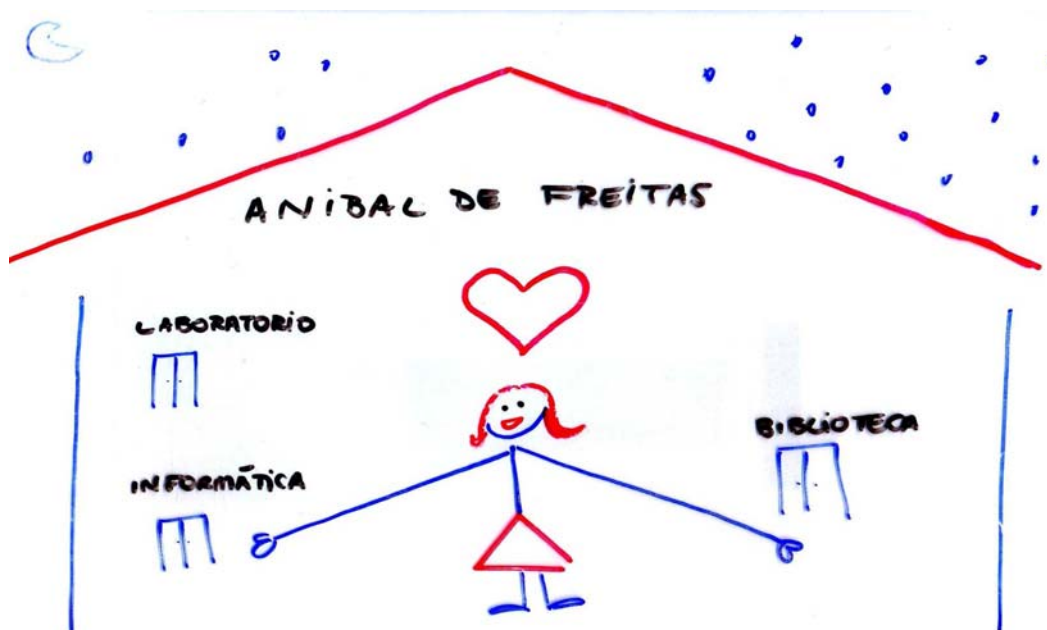
Figura 1 – A professora de braços abertos