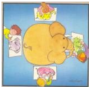
Ilustração de Avelino Guedes e capa do Livro de FORJAS, Sonia Salermo. Ponto de Vista . São Paulo: Moderna, 1992.

Para compreender a complexidade do lugar ocupado por cada sujeito trazemos a ilustração de um livro infantil para compreendermos que os discentes e os docentes também estão em um espaço e tempo múltiplo, carregado de sentidos, saberes, sentimentos e interage com as redes de conhecimento que produzem olhares singulares fabricando micro-diferenças e legitimam saberes e valores.