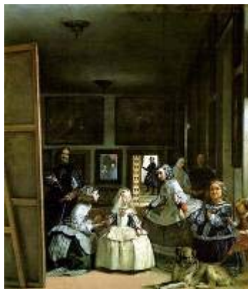
Diego Velazquez, Las Meninas (La famiglia di Filippo IV o Le damigelle d'onore), 1656, Museo del Prado, Madrid ) http://museoprado.mcu.es 10/07/2005 - 9h e 30min.

Continuando a enfrentar o problema metodológico no uso de imagens e tentando, também, discutir as questões propostas, trazemos o quadro de Diego Velázquez “Las Meninas” (1656) para nossa reflexão.