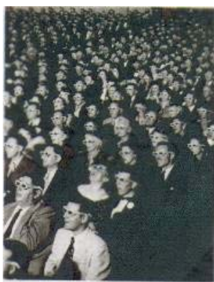
Cartão postal de um cinema de terceira dimensão da década de 50 doado por uma colega.

Ainda no interior dessa discussão incluímos outra a respeito do olhar hegemônico de uma ciência moderna que parece, ainda, tentar nos fazer acreditar que usamos os mesmos “óculos” [conhecimento]. Como na imagem do cinema de terceira dimensão no cartão postal abaixo, muitos professores podem estar pensando que todos os alunos vêem a mesma imagem de célula apresentada nas aulas. Os conhecimentos nem sempre presentes nos textos ignoram nossas redes de subjetividades presentes no momento que estamos vendo a célula eucariótica.