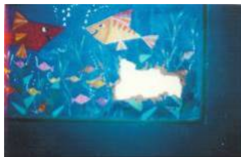
Fotografia tirada pela turma 601 da Escola TGM - Fotografia tirada pela turma 609 da Escola TGM

As imagens do mesmo mural, mas apresentado de forma completamente diferenciada, nos fez “ver” o que não víamos ao olhar aquele espaço: que existem vários olhares sobre a mesma realidade (imagem). A crescente-se a isso que essas fotografias dos murais fizeram emergir um “ver” no qual pudemos entender que vemos o que cremos e, ainda, os múltiplos olhares sobre qualquer imagem. No caso da reflexão sobre o ensino sobre a célula eucariótica, as imagens carregam a complexidade dos conteúdos e formas no espaço e tempo em que nos encontramos mergulhadas. Afinal, “(...) as imagens significam muito mais do que simples meios de disseminação do conhecimento (...)” (Burke, 2004:62).