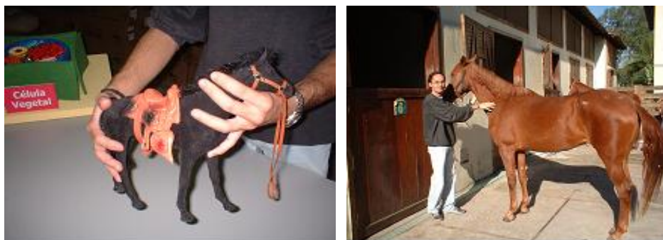
Figura 1: Comparação entre o manuseio de uma miniatura e o tamanho real de um cavalo.

Futuramente, pretende-se distribuir o material produzido a outras instituições especializadas que trabalhem com deficientes visuais e compararemos os resultados obtidos. O projeto PRÓ-VISÃO procura mostrar que os Mini-Museus podem ser construídos, fugindo do mito de “lugar de recordações”. E podem ser usados como recursos de acompanhamento do ensino regular pelos profissionais que trabalham com deficientes visuais, o que pode facilitar o processo de aquisição de informações e posterior aprendizagem.