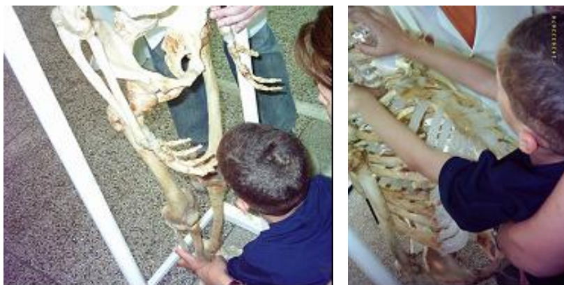
Figura 3: Aluno com deficiência visual sendo auxiliado por professora especializada no manuseio do esqueleto humano.