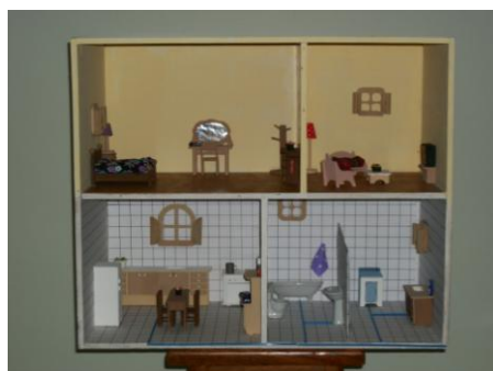
Figura 2 – “Casinha” apresentando sistemas de abastecimento, reuso e de recirculação de águas

Assim, em aulas de Matemática e de Física, por exemplo, o uso da maquete apóia o ensino das figuras geométricas, do cálculo de áreas e distâncias, dos conceitos físicos presentes no dimensionamento das estações de tratamento e em sua dinâmica de funcionamento, dentre outros.