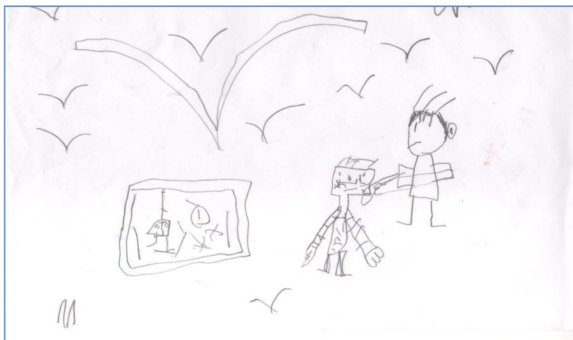
Figura 1. Desenho feito por Nelson.

O cientista é, neste caso, um inventor e o objeto de criação é um robô controlado por ele.