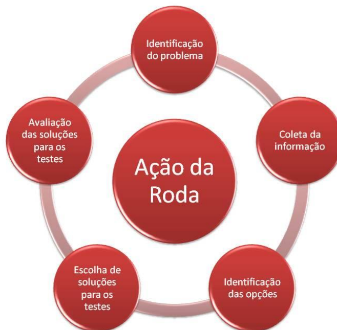
Figura 1 – Passos da Metodologia Alternativa “Ação da Roda” contextualizada nas questões do ENEM.

anteriormente em 2011, tendo sido constatado o êxito nos resultados. A metodologia consiste das seguintes técnicas: manipulação da informação, seleção daquelas mais importantes e escolha da opção certa de resposta, realizadas de forma cíclica, como mostra a figura a seguir: