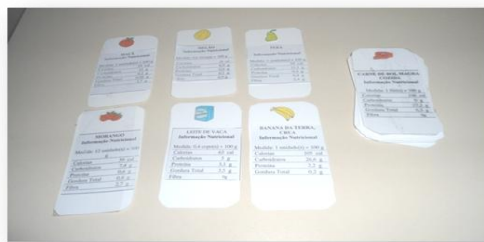
Figura 01 – Jogo supertrunfo – (informações nutricionais dos alimentos)

os valores nutricionais dos alimentos naturais e industrializados. O jogo supertrunfo pode ser observado na figura 01.