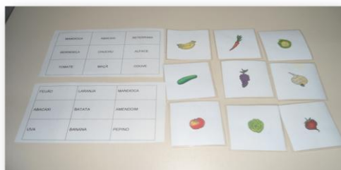
Figura 2 – Bingo frutas, raízes e verduras

Como incentivo para que os demais alunos da escola valorizassem a alimentação escolar, a décima atividade foi a “Mostra de Materiais”, para a qual organizou-se um bingo de raízes e verduras; frutas, fantoches, e uma trilha como pode-se verificar nas figuras 02,3 e 4, a seguir: