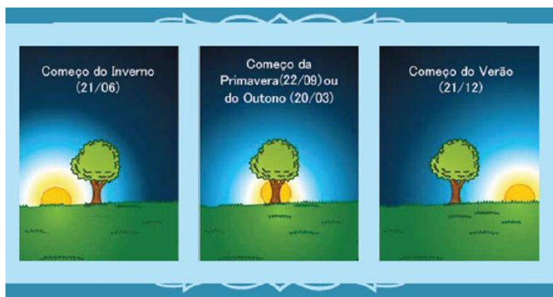
Figura 2: Imagem da “Dança no Horizonte” do livro CS, adaptado de Queiroz et al.(2012, p.20).

Sobre esse assunto, G4, na Q3, chega a mencionar o uso da árvore como ponto de referência para mostrar a posição do Sol em certas épocas do ano, relacionando este fato com “o fenômeno do Solstício”: