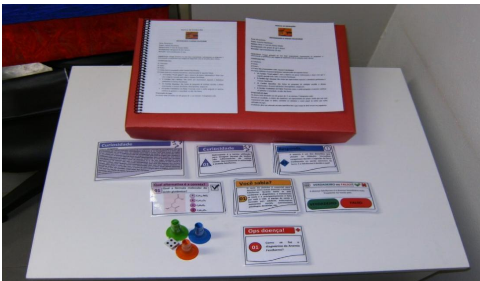
Figura 3. Peças do Jogo Desvendando a Anemia Falciforme.

O jogo é relativamente simples e rápido. É possível terminá-lo em 15 minutos e se joga coletivamente. O grupo deverá chegar primeiro na reta final respondendo corretamente as perguntas e relacionando os problemas que surgem no organismo com as soluções mais viáveis. Os alunos serão divididos em três grupos de 2, no máximo, 5 integrantes cada.