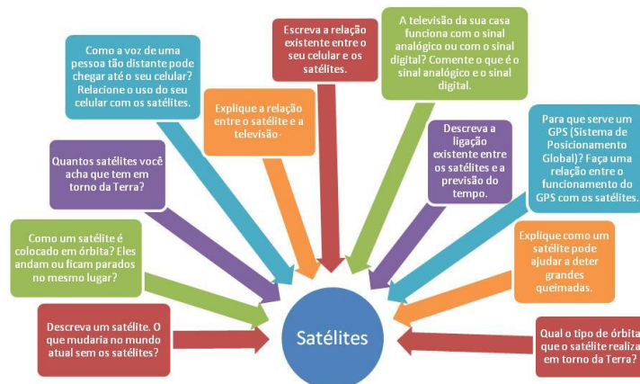
Figura 5: Questões desencadeadoras do estudo do tema Satélites Artificiais.

Estes questionamentos tiveram o objetivo de contextualizar o tema gerador e estimular os estudantes à reflexão, dessa forma, foram incentivados a responder as questões levantadas, momento em que era percebido o conhecimento que os mesmos possuíam sobre o conteúdo tratado. Após a problematização foi trabalhado o conteúdo previsto para a série, por exemplo, o estudo do Movimento, Força, Gravitação universal e velocidade foi iniciado com a problematização de Satélites Artificiais. No terceiro momento pedagógico, a aplicação do conhecimento, no qual as questões iniciais eram novamente levantadas com o intuito dos alunos apropriarem-se dos conhecimentos agora adquiridos para respondê-las, fechando assim o ciclo da metodologia problematizadora de Freire.